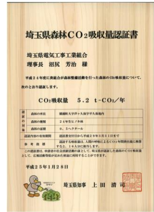
森林CO 2 吸収量認証書