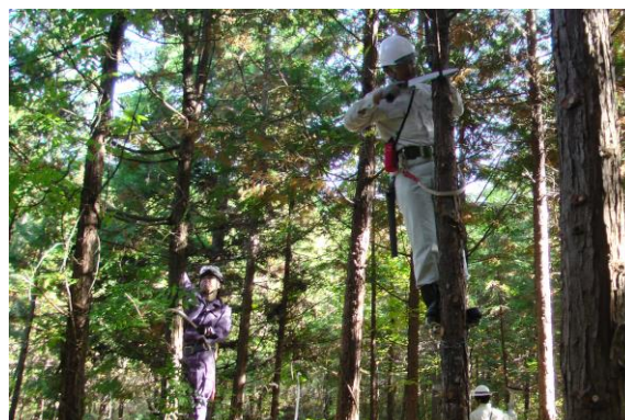
梯子を使用しての枝打ち