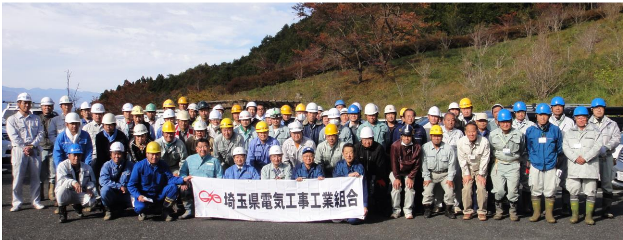
参加者の集合写真