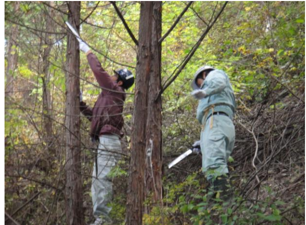
枝打ち作業の様子