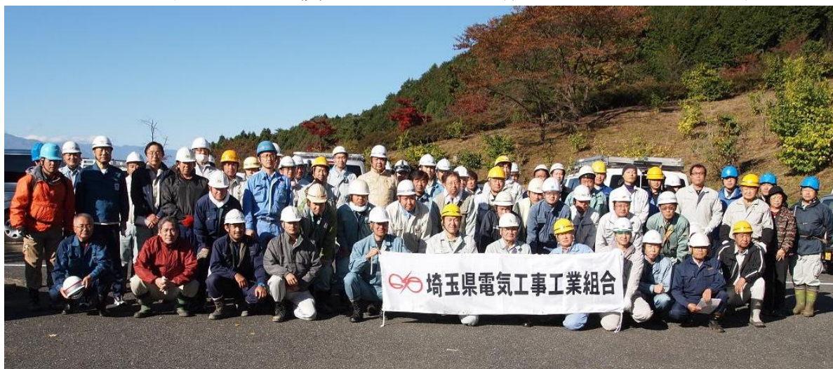
参加者の集合写真

第5回（平成22年11月4日） 秩父郡横瀬町大字芦ヶ久保字平久保地内 参加者 74名 実施面積 1.00ha（枝打高0～1.8m）