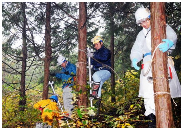
梯子を使用しての枝打ち