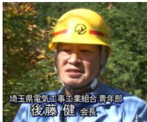
NHK、テレビ埼玉で報道されました。