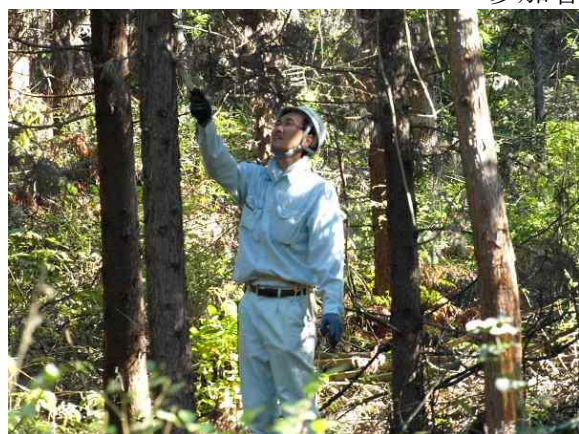
枝打ち作業の様子