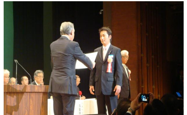
全日電工連会長表彰状（優良事業工組表彰制度銅賞） （平成27年11月12日）