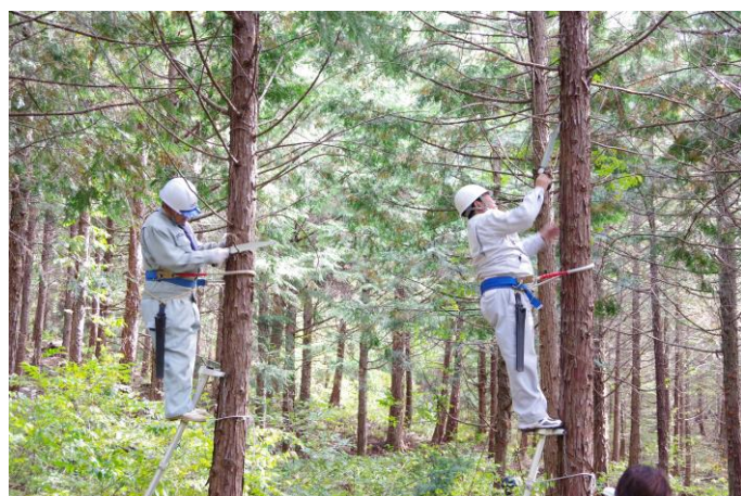
梯子を使用しての枝打ち