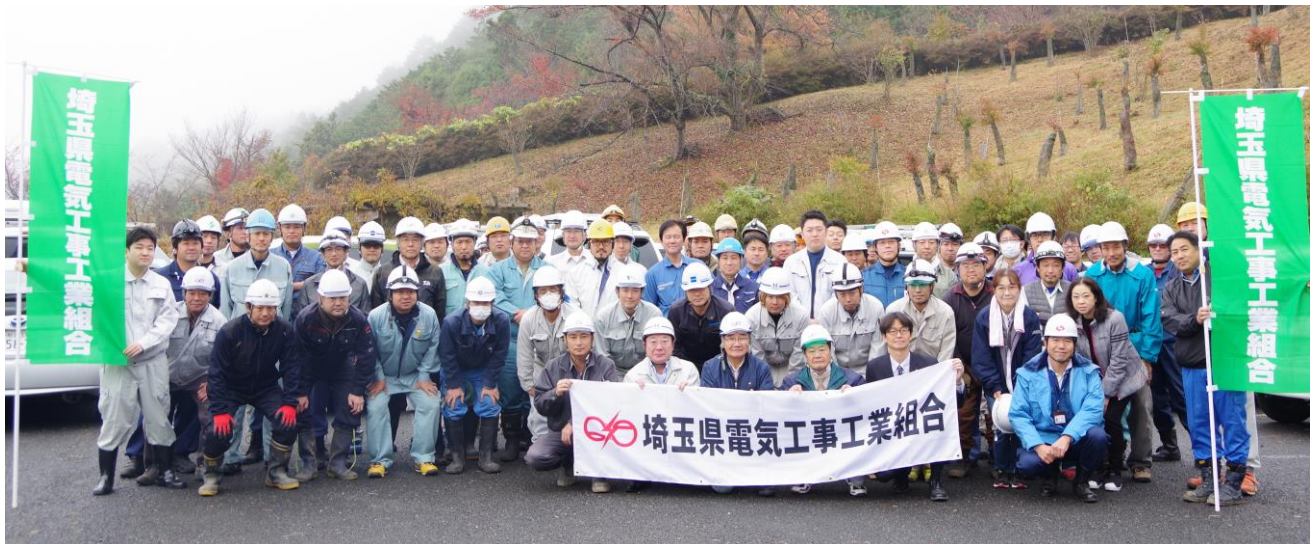
参加者の集合写真