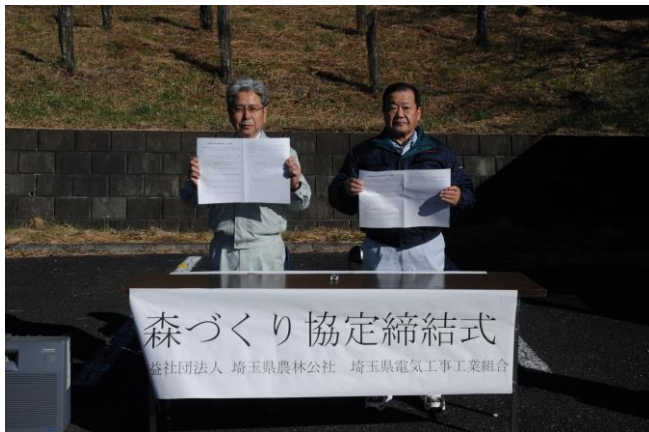
森づくり協定更新

第11回（平成28年11月9日） 秩父郡横瀬町大字芦ヶ久保字平久保地内 参加者 79名 実施面積 0.50ha（枝打高1.8～4.0m）