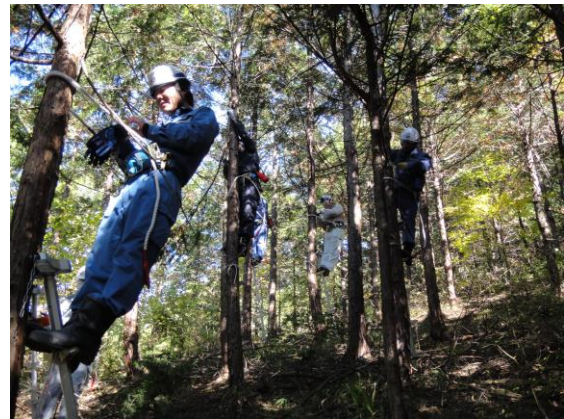
梯子を使用しての枝打ち