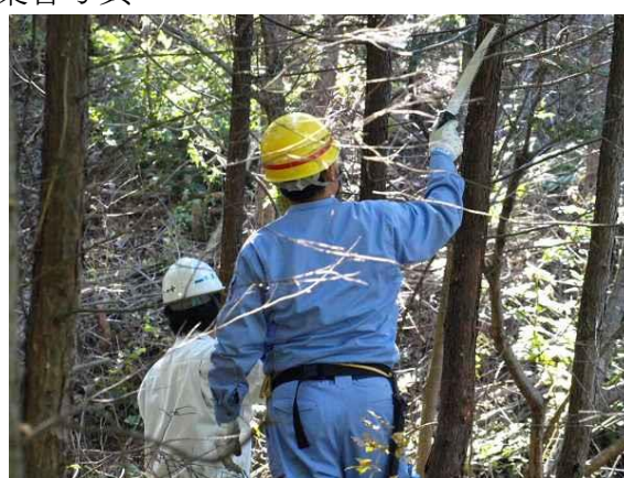
一生懸命に作業する青年部会員