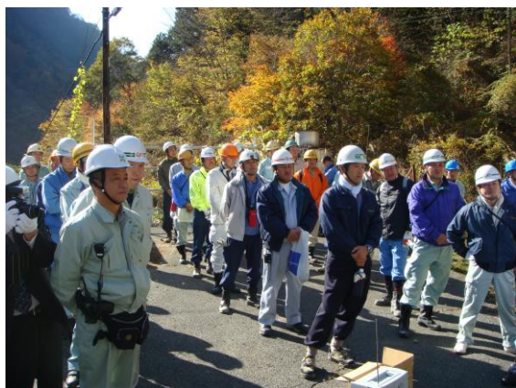
第2回からは青年部会の事業として実施

第2回（平成19年11月8日） 秩父市中津川字赤岩地内 参加者 67名 実施面積 0.40ha（枝打高0～1.8m）