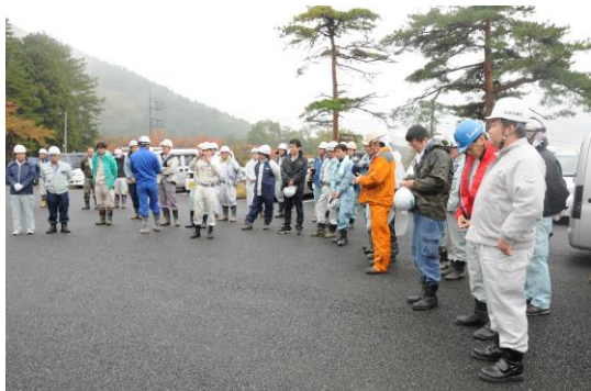
悪天候の中での入山式

第8回（平成25年11月7日） 秩父郡横瀬町大字芦ヶ久保字平久保地内 参加者 72名 実施面積 0.85ha（枝打高1.8～4.0m）