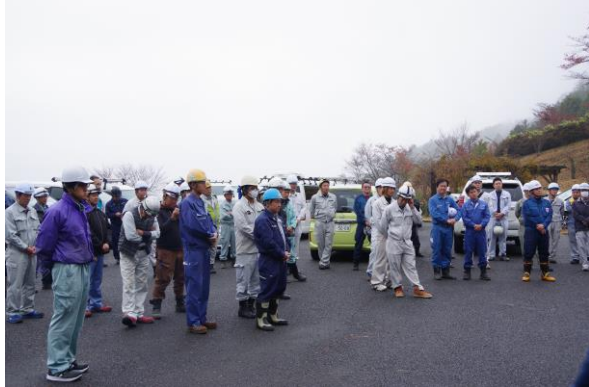
悪天候の中での入山式

第13回（平成30年11月9日） 秩父郡横瀬町大字芦ヶ久保字平久保地内 参加者 80名 実施面積 0.40ha（除伐作業）