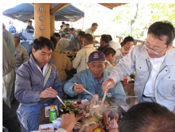
昼食会（バーベキュー）を実施