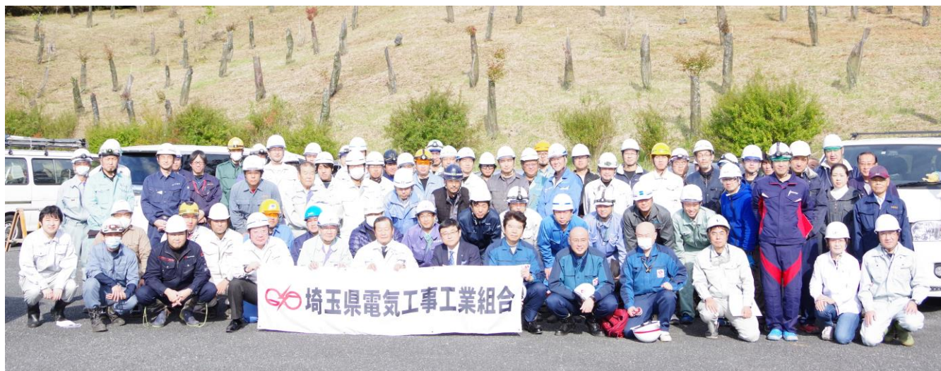
参加者の集合写真（過去最多の84名）