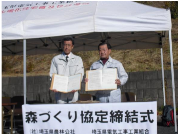
森づくり協定締結

第7回（平成24年11月8日） 秩父郡横瀬町大字芦ヶ久保字平久保地内 参加者 75名 実施面積 0.47ha（枝打高1.8～4.0m）