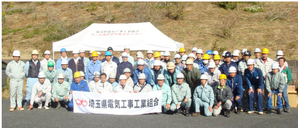
参加者の集合写真