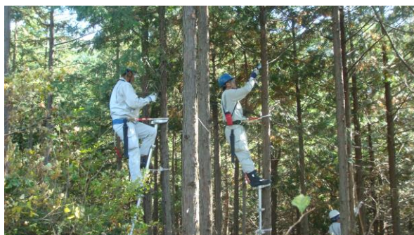
梯子を使用しての枝打ち