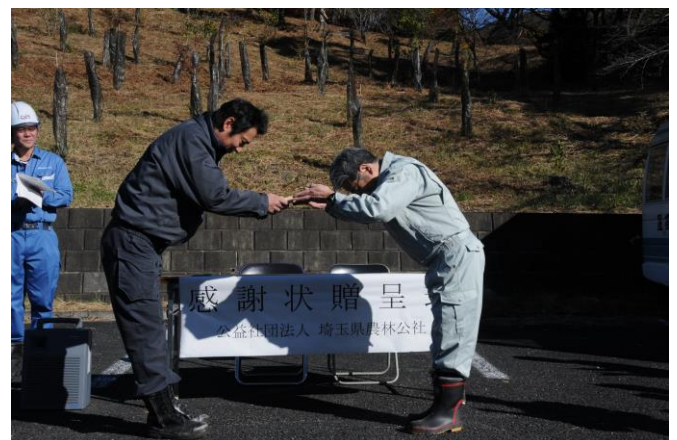
埼玉県農林公社理事長感謝状 （平成28年11月9日）