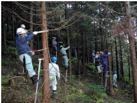
梯子を使用しての枝打ち開始