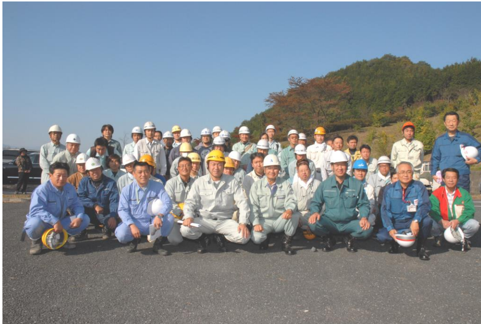
参加者の集合写真