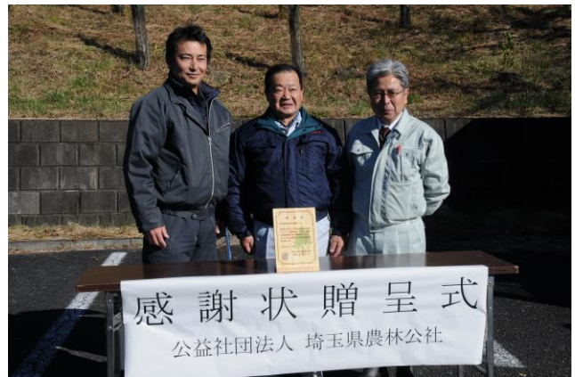
農林公社から感謝状