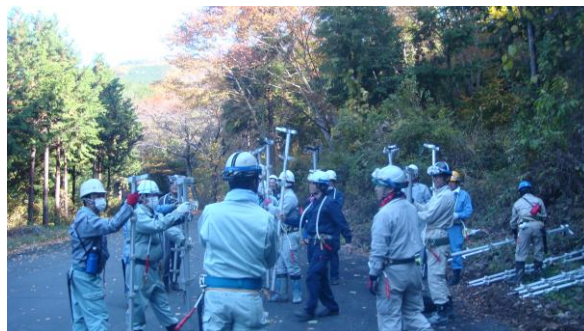
入山前に梯子を準備