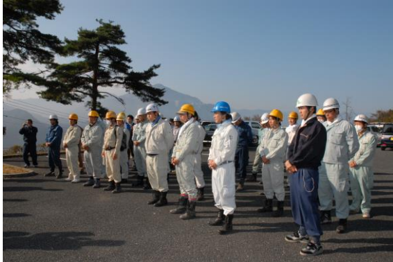
場所を秩父郡横瀬町大字芦ヶ久保字平久保地内へ

第4回（平成21年10月29日） 秩父郡横瀬町大字芦ヶ久保字平久保地内 参加者 64名 実施面積 0.50ha（枝打高0～1.8m）