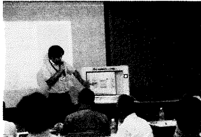
日東工業のデモンストレーション

参加者からは「感震ブレーカーの重要性を改めて認識できた」、「いろいろなメーカーの感震ブレーカーの紹介があり、それぞれの特長が良く理解できた」などの感想が寄せられた。