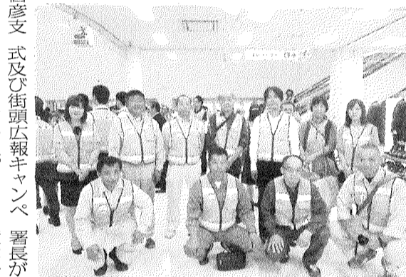
出発式での記念写真