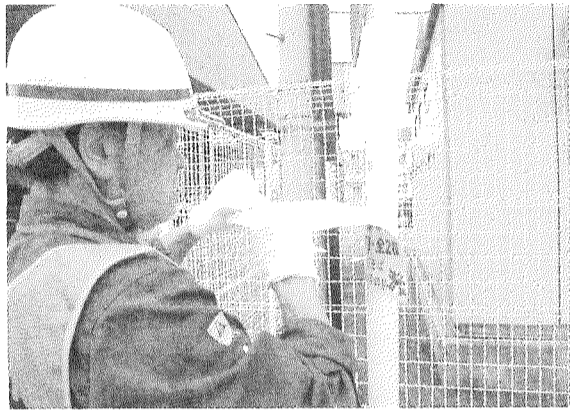
違反広告物を撤去する組合員

このボランティアは、ねる違反広告物を撤去し、良好な街並みの景観形成を図ることが目的。さいたま市の美化に貢献した。