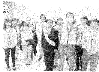
値賀支部長（右から3人目）と参加した組合員